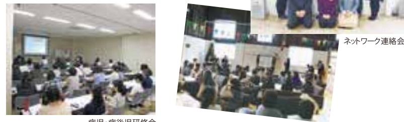
病児・病後児研修会